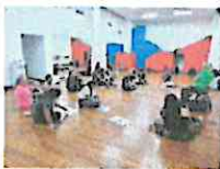
LECTURA ULTIMA ESCENA