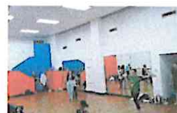
DELIRIO DE AMOR