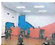
DELIRIOS DE AMOR